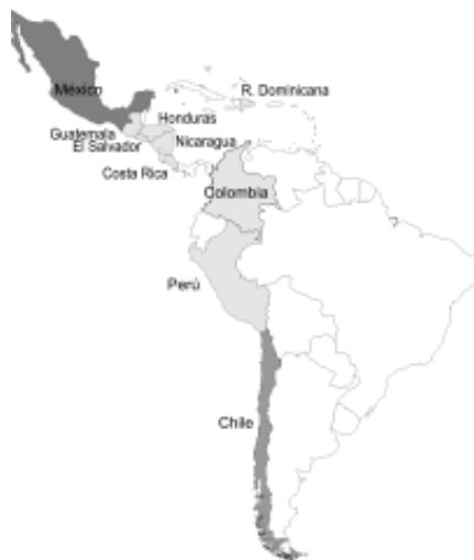
Tratados y acuerdos de libre comercio de Estados Unidos con países clave de América Latina

negociaciones se iniciaron en 2004; Ecuador y Bolivia abandonaron las tratativas, y solamente Perú y Colombia llegaron a un acuerdo, ratificado en sus países pero que espera la ratificación en el congreso de EE.UU. El convenio levantó duros cuestionamientos desde sectores agropecuarios, farmacéuticos, industriales, etc., por el temor del desplazamiento de la producción nacional a partir de la invasión de productos importados desde los Estados Unidos. De hecho, una reciente evaluación para el caso colombiano demuestra que ese país aceptó peores condiciones que las concedidas por Washington en el marco del CAFTA y del tratado con Chile, y predicen efectos negativos a largo plazo sobre varios productos (Garay y colab., 2006). A lo largo de las negociaciones, EE.UU. apuntó a desmantelar el sistema andino de franjas de precios, rechazó negociar sus subsidios internos (apelando nuevamente a invocar que ese tema se debe resolver en la OMC), buscó mantener sus mecanismos de defensa por productos, volumen o por alteraciones en los precios, así como sus instrumentos de créditos a las exportaciones.